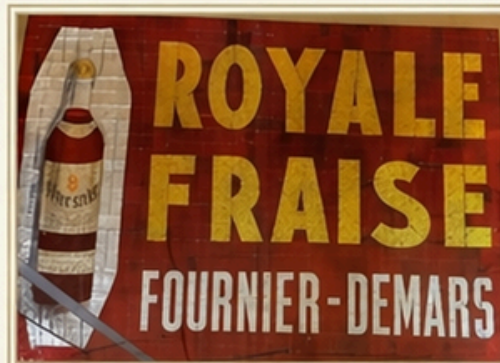
Mosaïque publicitaire Art Déco témoignage d'une industrie locale