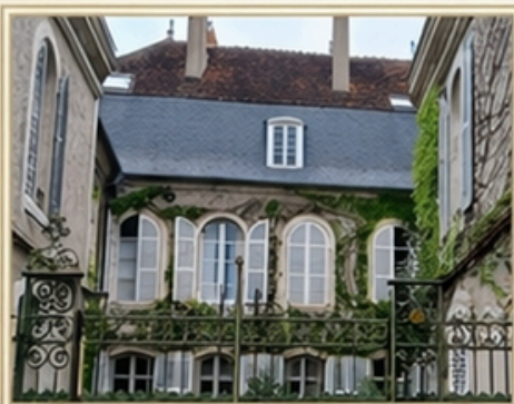
L'Hôtel particulier du XVII e siècle, joyeux de la ville