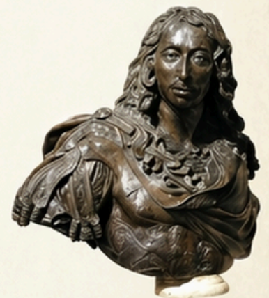
Buste de Louis II de Bourbon-Condé, dit le Grand Condé.